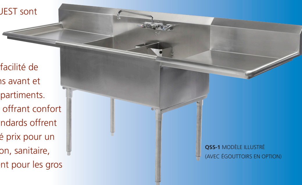
QSS-1 MODÈLE ILLUSTRÉ (AVEC ÉGOUTTOIRS EN OPTION)

Ils sont conçus pour une facilité de nettoyage avec des rayons avant et arrière à chacun des compartiments. Les rebords sont arrondis offrant confort et sécurité. Ces éviers standards offrent le meilleur rapport qualité prix pour un évier d'une telle fabrication, sanitaire, conçus exceptionnellement pour les gros travaux.